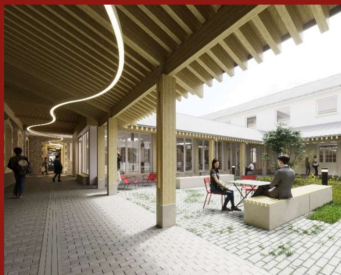
La coursière longe la cour

Le chantier débutera en décembre par deux mois de démolition du bâtiment E et de curage de la bibliothèque existante. Le curage consiste à mettre les murs à nu en retirant tous les revêtements de sol, faux-plafonds et réseaux. Débuteront ensuite les travaux de construction de l'extension et de restructuration de l'existant prévus sur une durée de 15 mois.